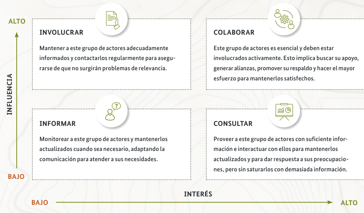
Figura 2.2: Matriz de grupos de interés clave