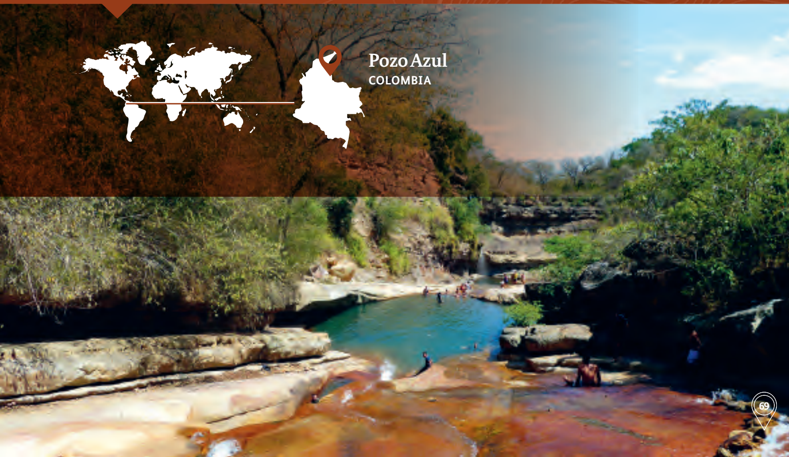
Pozo Azul COLOMBIA

Desde la identificación de las medidas de política, se han llevado a cabo varias reuniones con múltiples grupos de interés para discutir el futuro de Pozo Azul, lograr el apoyo de más actores y discutir cómo fortalecer su gestión ( paso 4 del enfoque ISE). Las reuniones han involucrado a grandes corporaciones mineras con interés en la región, agricultores locales y autoridades distritales, entre otros. La implementación del plan de gestión turístico de Pozo Azul ya se encuentra en marcha ( paso 6 ).